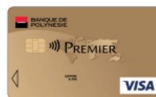
Carte Visa Premier* 5 855 F TTC