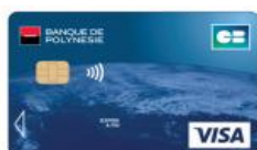
Carte Visa Classique* 4 625 F TTC