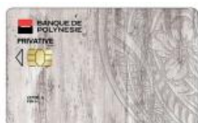
Carte HOA Privative 4 420 F TTC