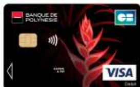
Carte Visa Red