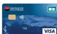
Carte Visa Classique à débit immédiat ou différé