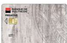
Carte HOA Privative