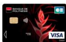
Carte Visa Red