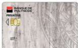
Carte HOA Privative