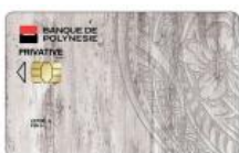
Carte HOA Privative