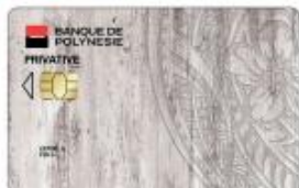
Carte HOA Privative