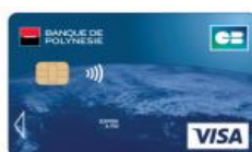
Carte Visa Classique à débit immédiat ou différé