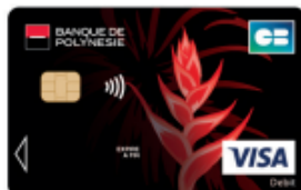
Carte Visa Red