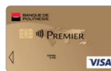
Carte Visa Premier à débit immédiat ou différé