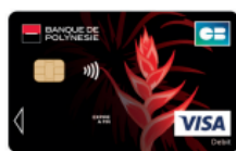
Carte Visa Red